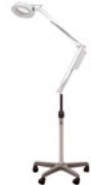
lente con stativo