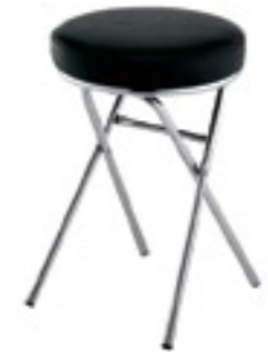
sgabello cliente nero