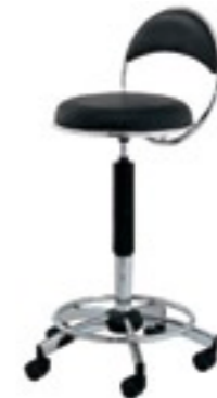
sedia sw elegant