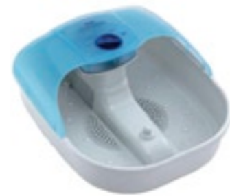
pedi foot massage