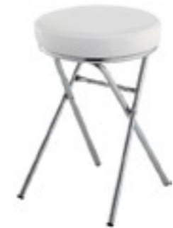
sgabello cliente bianco