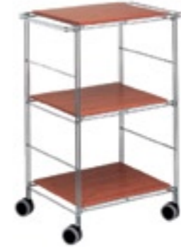
carrello metallo legno