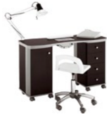
tavolo doppio wengè