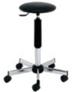
sedia sw simple